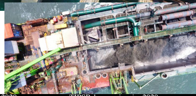
TIPSP dragage janvier 2020

Le Port Autonome de San Pedro (PASP) s'est engagé dans un vaste programme de modernisation et d'extension des infrastructures portuaires, notamment par la réalisation de terminaux spécialisés : le Terminal Industriel Polyvalent (TIPSP), le Terminal à Conteneurs (TCSP), le Terminal Polyvalent Commercial (TPCSP), le Terminal Hydrocarbure de San Pedro, etc. Ces terminaux, prévus dans le schéma directeur de développement du Port de San Pedro, document stratégique aligné sur le Plan National de Développement, s'inscrivent dans la vision de SEM Alassane OUARTARA, Président de la République, de faire de la Côte d'Ivoire une Nation prospère avec une économie dyna-