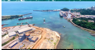
TIPSP avant remblai septembre 2019